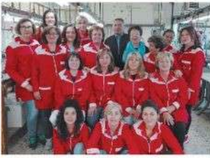
Tutto donne. È una caratteristica dell'azienda, l'unico anno che appare solitario è l'anno della nascita. La svedese non lavora in città.

in pelle. Presso e cuciture a mano sono gli "strumenti" di lavoro, che danno vita a capi destinati alla distribuzione e in particolare ad alcuni grandi negozi di abbigliamento. "Ho azienda di abiti long", di come alcune delle dipendenti, ormai quasi tutte di una stessa famiglia. "È raro, presagione - trovare oggi realtà imprenditoriali che mantengono in serbo per così tanti