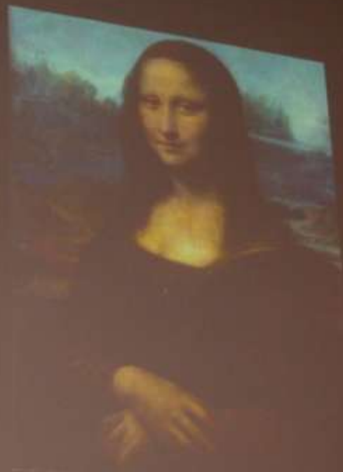
La Madonna Crespi